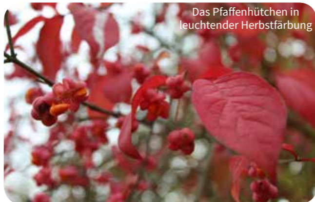
Das Pfaffenhütchen in leuchtender Herbstfärbung