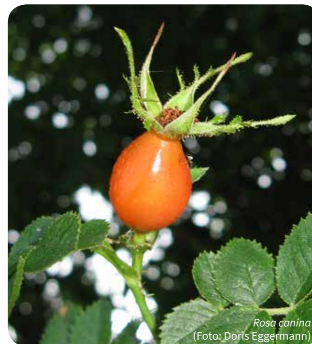
Rosa canina