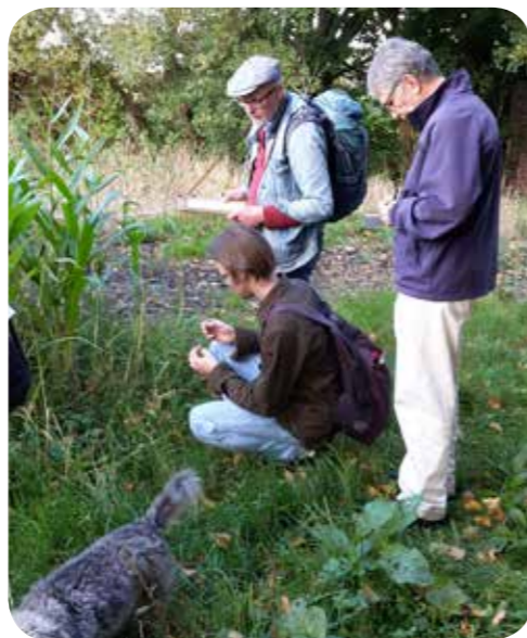
Auch an schlichten Ackerrändern waren zahlreiche Arten zu finden

sicher von dem ähnlichen Ampferblättrigen Knöterich Persicaria lapathifolia unterschieden werden.