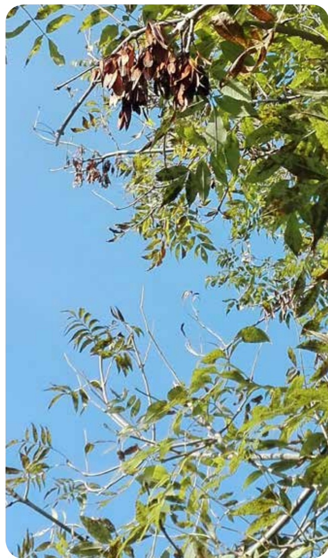
Grünes Laub und braune Flügelnüsse sind typisch für die Esche

Ihre großen gefiederten Blätter, die erst spät im Frühjahr erscheinen, wirft die Esche im Herbst noch grünlich ab. Ihr fruchtbarer Standort macht es unnötig, Stickstoff und Chlorophyll vor dem Laubfall aus den Blättern abziehen und einzulagern. Auch im Sommer entledigt sich die Esche bisweilen grüner Blätter, wenn diese nicht ausreichend besonnt werden. Das nahrhafte Laub der Esche wurde früher durch Schneitelung geerntet und als Winterfutter für das Vieh verwendet.