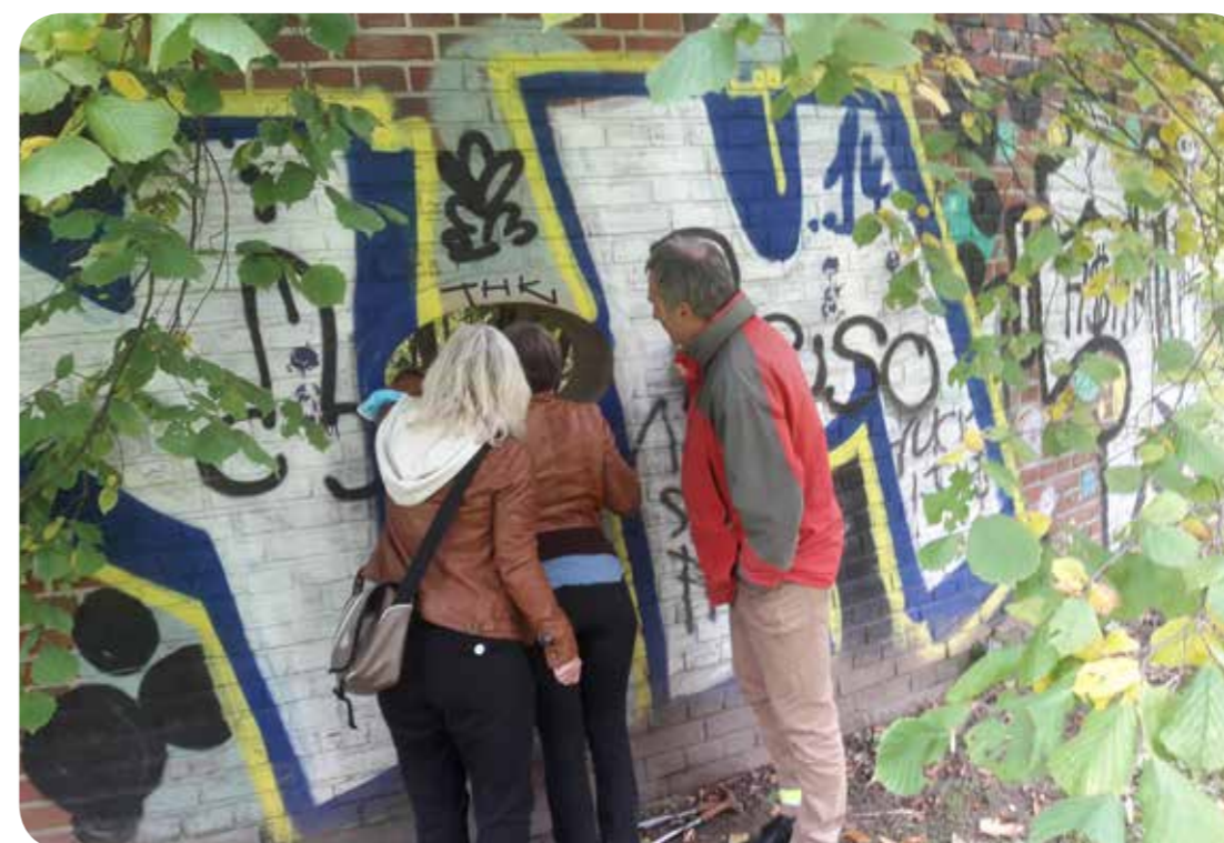
Mitglieder der AG Botanik bei der jährlichen Bestandserfassung im sanctuarium:

Die Artenzahl stieg in den ersten Jahren an, erreichte nach sechs Jahren ein Maximum und geht seitdem stark zurück. In den letzten Jahren hat sich die Artenzahl auf niedrigem Niveau eingependelt, und auch die Zusammensetzung bleibt fast konstant. So war auch in diesem Jahr keine Überraschung zu verzeichnen. Wie es aussieht, wird die Artenkombination auch bis zum kommenden Jahr konstant bleiben – selbst wenn die fleißigen ehrenamtlichen Biotoppflegerinnen des NABU anrücken.