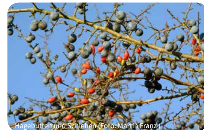
Hagebutten und Schlehen

Manche Menschen reagieren allerdings etwas empfindlich auf die möglicherweise in dem Mark noch vorhandenen Härchen, darum kann man dieses Mus (oder „Mark“) noch einmal durch ein sehr feines Sieb streichen.