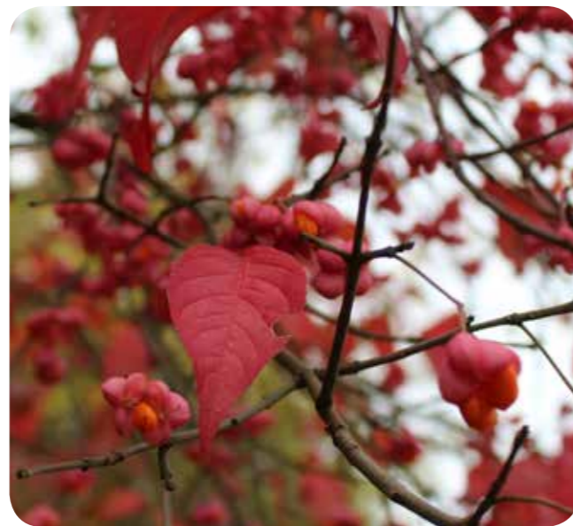
Foto oben: Pfaffenhütchen Euonymus europaeus in Herbstfärbung

Ihr/Euer Thomas Hövelmann, Leiter der NABU-AG Botanik in Münster