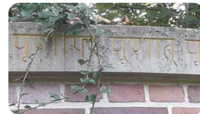
Eine Sanskrit-Inschrift ziert den oberen Rand der Mauer

Da die AG Botanik das Wachstum im sanctuarium von Beginn an begleitet hat, gibt es einen interessanten Überblick über die Entwicklung der Arten und ihre Zusammensetzung. Im ersten Jahr wuchs dort noch – eigentlich entgegen der ursprünglichen Konzeption – eine Wildblumenmischung, die bereits nach wenigen Jahren von mehrjährigen Stauden abgelöst wurde. Nach drei Jahren siedelten sich dann die ersten Gehölzarten an, teilweise auch fremdländische Arten aus dem angrenzenden Schlosspark.