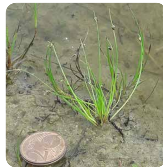
Borstige Schuppensimse Isolepis setacea

Bei den Monatstreffen können jeweils Pflanzen oder Bilder von Pflanzen vorgestellt werden.