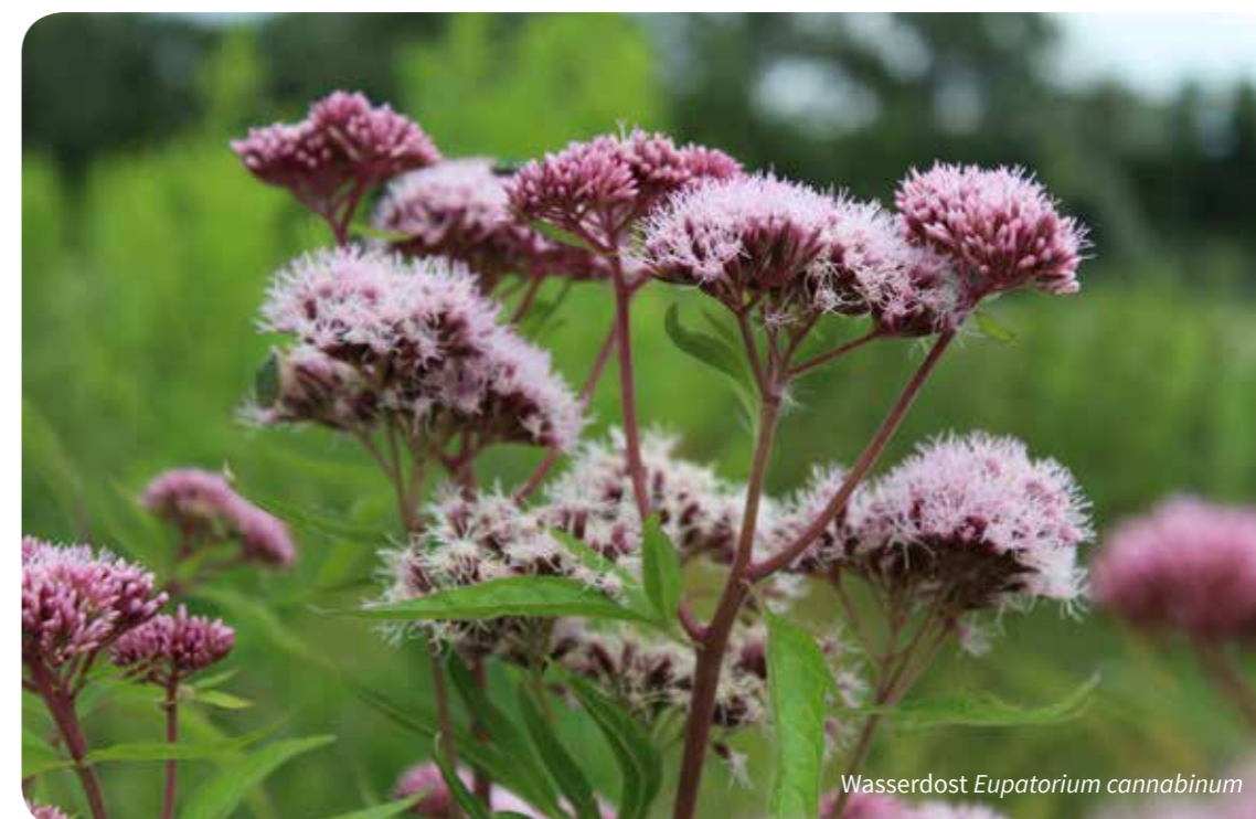
Wasserdost Eupatorium cannabinum