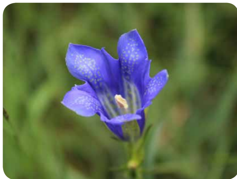
Titelbild und oben: Lungen-Enzian Gentiana pneumonanthe

Ihr/Euer Thomas Hövelmann, Leiter der NABU-AG Botanik in Münster