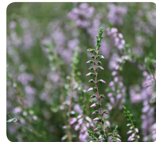
Besenheide Calluna vulgaris

Eigentlich war geplant, im Rahmen der Exkursion noch die Insektenerrassungen der NABU-Naturschutzstation Münsterland vorzustellen. Dabei werden auf jeweils 1 qm großen Probeflächen fünf Minuten lang alle blütenbesuchenden Insekten notiert, unterteilt in grobe Hauptgruppen wie Schmetterling, Hummeln und Wildbienen.