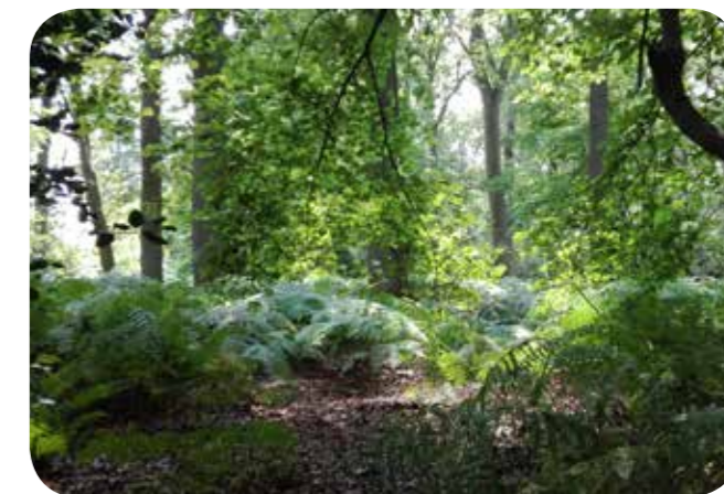
Der Jesuiterbrook ist ein schöner naturnaher Wald bei Berg Fidel