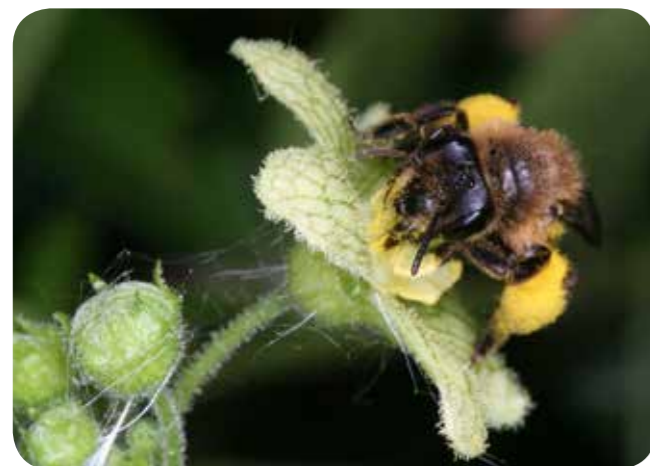
Die Zaurrüben-Sandbiene

Es werden weiterhin Vorkommen der Roten Zaurrübe Bryonia dioica in Zusammenarbeit mit der NABU-AG Bienen gesucht. Die Zaurrübe ist die einzige Futterpflanze der faszinierenden Zaurrüben-Sandbiene.