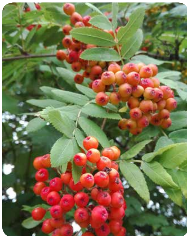
Die Früchte der Eberesche werden auch Vogelbeeren genannt

Erkennbar ist der kleine Baum, der zur Familie der Rosengewächse gehört, an seinen gefiederten Blättern, die denen der Gewöhnlichen Esche ähneln und ihm den Namen „Eberesche“ (Eber = Aber = falsch) gaben.