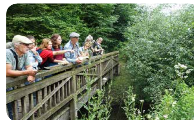
Im Regenrückhaltebecken am Vennheideweg gab es viel Spannendes zu entdecken

Regenrückhaltebecken gehören – wenn sie naturnah angelegt sind wie am Vennheideweg – zu wertvollen Rückzugsräumen für zahlreiche Pflanzenarten feuchter und nasser Standorte. Von der großen Blütenvielfalt, die meist erst im Hochsommer erblüht, profitiert eine große Zahl von insektenbesuchenden Insekten, die um diese Jahreszeit anderenorts kaum noch Nahrungsquellen finden.