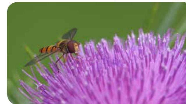
Schwebfliegen lieben die Blütenköpfe der Gewöhnlichen Kratzdistel