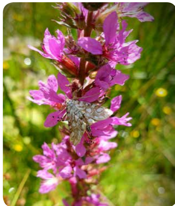
Der Blutweiderich in der Haselbachaue zieht viele Schmetterlinge an

Die Haselbachaue in Dülmen-Dernekamp ist ein stadtnahes Kleinod, das sich im Besonderen durch seine vielfältige Hochstaudenflur auszeichnet. Wasserdost, Gilbweiderich und Engelwurz gedeihen in diesem Gebiet, das von 15 Tümpeln wesentlich geprägt wird. In und an den Gewässern, den umgebenden feuchten Wiesen und Brachen sowie im angrenzenden Feuchtwald gedeiht eine Vielzahl von seltenen Pflanzenarten, das Gelände bietet aber u.a. auch vielen seltenen Schmetterlingsarten wie dem Kaisermantel und dem Kleinen Feuerfalter, die bei der Exkursion ebenfalls entdeckt wurden, Nahrung und Lebensraum.