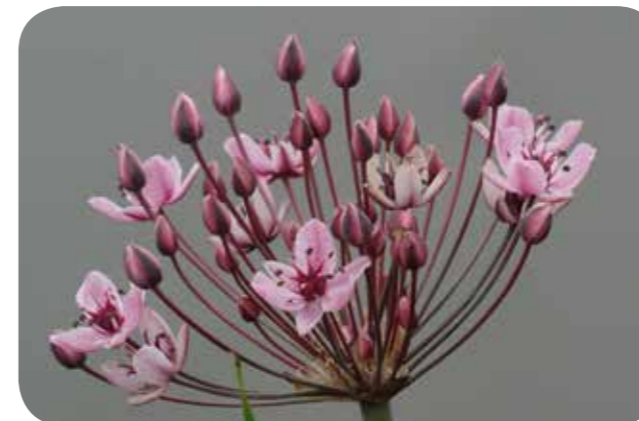
Die Schwanenblume ist gelegentlich in der renaturierten Aa zu finden

Öffentliche botanische Exkursion mit Dr. Thomas Hövelmann entlang der renaturierten Aa an der Kanalstraße. Treffpunkt ist um 15 Uhr an der Kanalstraße/Abzweig Nevinghoff, Dauer ca. zwei Stunden.