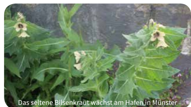
Das seltene Bilienkraut wächst am Hafen in Münster

Das Untersuchungsgebiet Hansaviertel war den Teilnehmenden bis dahin nicht bekannt. Obwohl gerade dieses Viertel sehr städtisch und urban überprägt ist, gab es dort in Pflasterritzen, auf Baustellen und Brachflächen und in den wenigen Grünanlagen eine erstaunlich große Artenvielfalt zu entdecken. Dabei galten sportliche Fairness und Regeln, die von allen Teilnehmern selbstverständlich eingehalten wurden - kein Problem, standen doch der Spaß an der Aktion und die Freude über das eigene Wissen im Vordergrund.