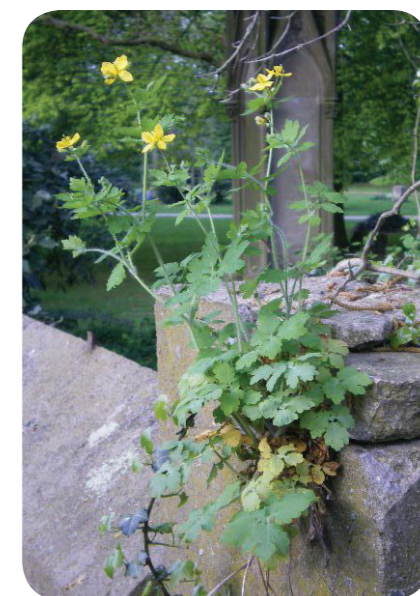
Schöllkraut ( Chelidonium majus )