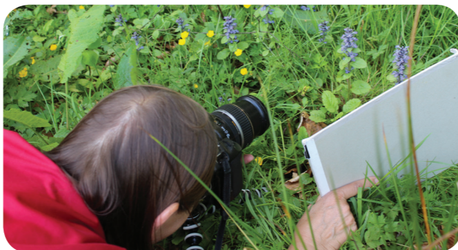
Hier wird vieles richtig gemacht: auf Augenhöhe mit dem Bildmotiv - dem Kriechenden Günsel ( Ajuga reptans ) - sowie Windschutz und Aufhellung durch reflektierende Pappen