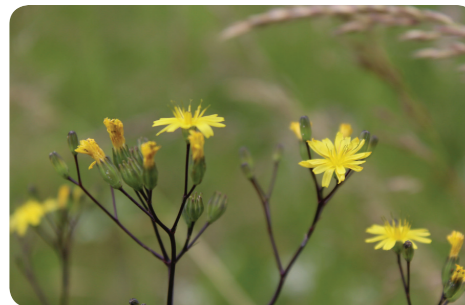
Rainkohl ( Lapsana communis )

Zu den Monatstreffen können gerne Pflanzen bzw. Fotos von Pflanzen zum Vorstellen oder gemeinsamen Bestimmen mitgebracht werden.