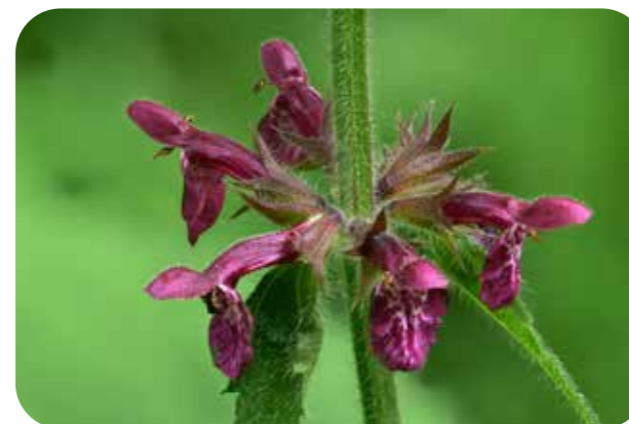
Blütenstand von Wald-Ziest Stachys sylvatica

Auch im August / September wurden wieder interessante Funde im Bild festgehalten. Bei den Monatstreffen können Pflanzen oder Bilder von Pflanzen vorgestellt werden.