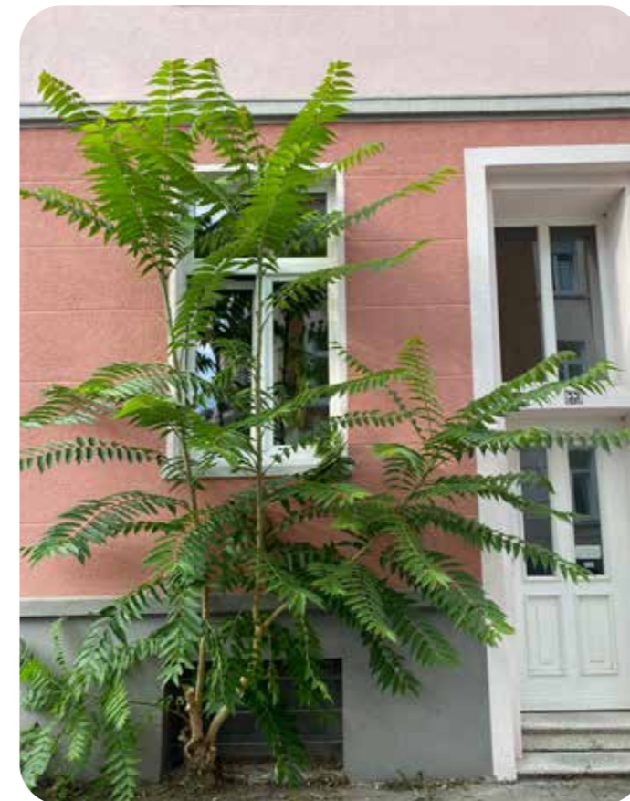
Ein Götterbaum im Kreuzviertel