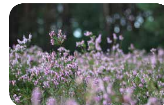
Die Besenheide steht derzeit in voller Blüte