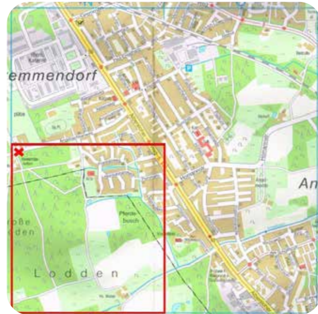
Das Untersuchungsgebiet N17 bei der Fridays for Flowers-Kartierung in Gremmendorf

Die zu bearbeitende Fläche erwies sich als ungewöhnlich naturnah und abwechslungsreich: neben kleinteiligen Siedlungsflächen, Kleingewässern, Hecken und Obstwiesen nahm das Waldgebiet „Loddenbüsche“ einen Großteil des Untersuchungsgebietes ein.