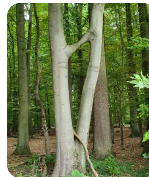
Bei dieser ‚siamesischen Buche‘ sind zwei Stämme der Rot-Buche Fagus sylvatica miteinander verwachsen