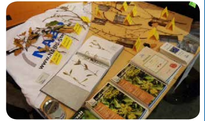
Infostand der AG Botanik bei einem früheren LWL-Ehrenamtsforum (Foto: Thomas Hövelmann)

Bild rechts: Im Gegensatz zum ähnlichen Essigbaum haben die Fiedern einen glatten Blattrand (Foto: Thomas Hövelmann)