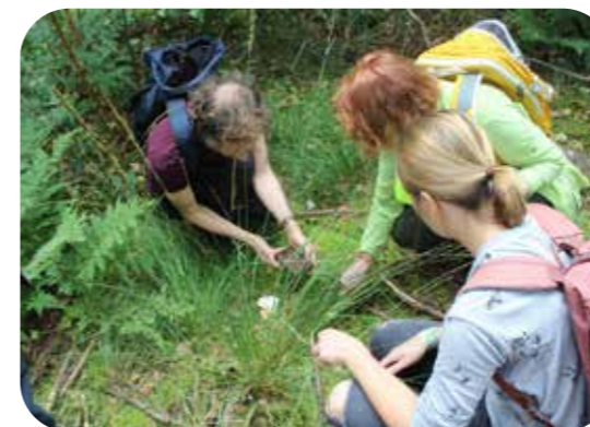
Pilz-Exkursion in die Hohe Ward

Teilnahme am Familientag des B-Side-Festivals mit Infostand und botanischen Führungen, siehe unten. Treffpunkt 11-18 Uhr auf dem Hansaplatz, Hansaring/Ecke Schillerstraße.