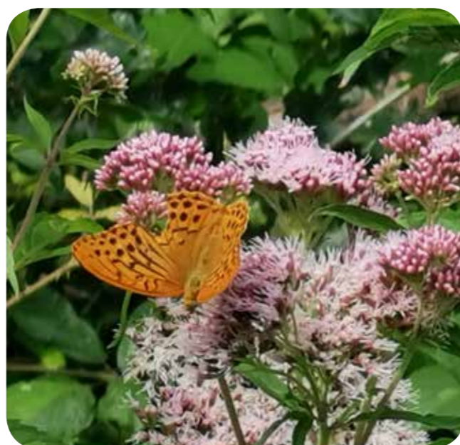
Kaisermantel auf Wasserdost Eupatorium cannabinum

Zum Monatstreffen im August wurden folgende Arten mitgebracht: Götterbaum, Rainfarn, Beifuß und Wasserdost.