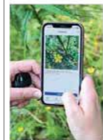
Artenbestimmungs-App auf Smartphone