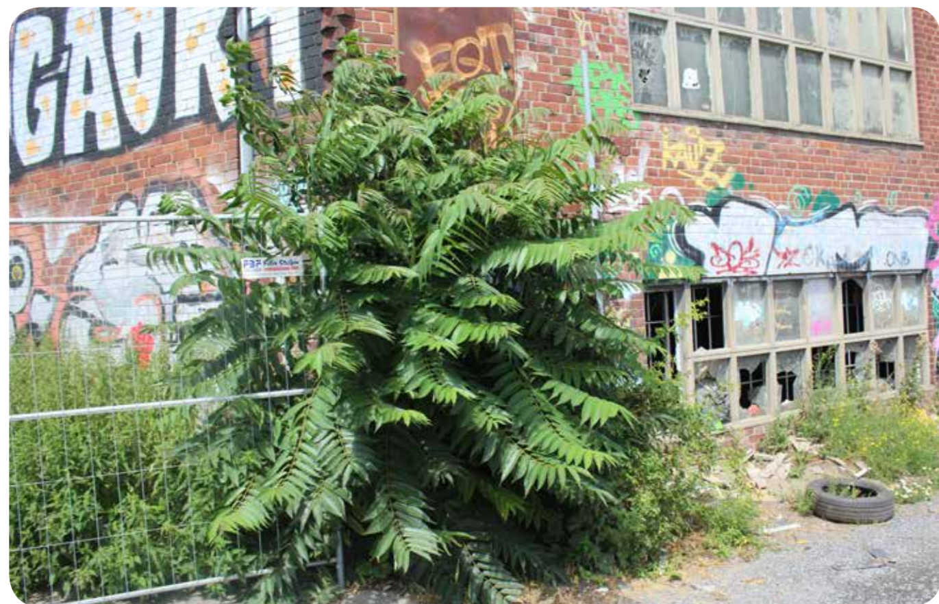
Der Götterbaum hat große, gefiederte Blätter