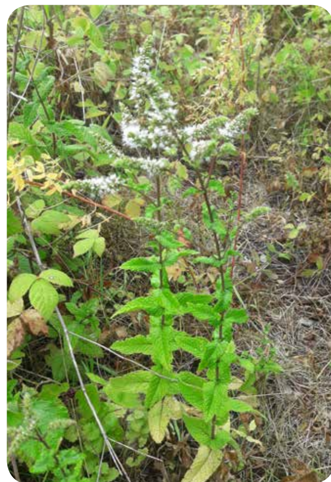
Die Grüne Minze Mentha spicata in einem Gewerbegebiet bei Coerde

Auch im Juli wurden wieder interessante Funde im Bild festgehalten. Bei den Monatstreffen können jeweils Pflanzen oder Bilder von Pflanzen vorgestellt werden.