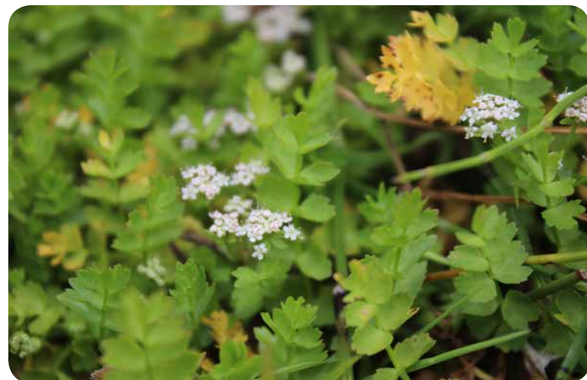
Der winzige Kriechende Sellerie ist im Münsterland sehr selten

Die Fridays for Flowers-Exkursionen dienen dazu, Verbreitungskarten aller wildlebenden Pflanzenarten in der „Flora von Münster“ zu erstellen. Dabei werden auf der Grundlage des Rasters im amtlichen Stadtplan der Stadt Münster vollständige Artenlisten aller 351 jeweils einen Quadratkilometer großen Quadranten erstellt und die Daten in das Portal naturgucker.de eingepflegt.