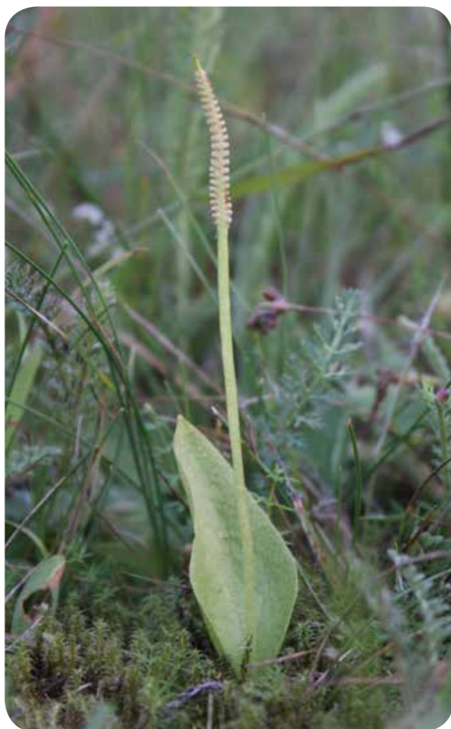
Die seltene Gewöhnliche Natternzunge Ophioglossum vulgatum ist ein Farn und kommt bei Handorf vor