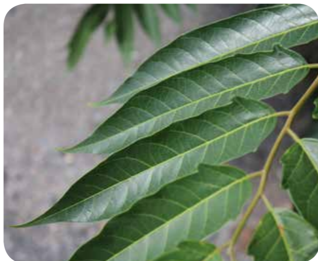
Bild rechts: Im Gegensatz zum ähnlichen Essigbaum haben die Fiedern einen glatten Blattrand

Wer Exemplare des Götterbaumes entdeckt, teile doch bitte AG-Leiter Dr. Thomas Hövelmann unter t.hoevelmann@NABU-Station.de den genauen Fundort mit (ggf. mit Foto). Markant sind vor allem die riesigen gefiederten Blätter mit ganzrandigen Fiedern, die nach alten Tennisschuhen riechen.