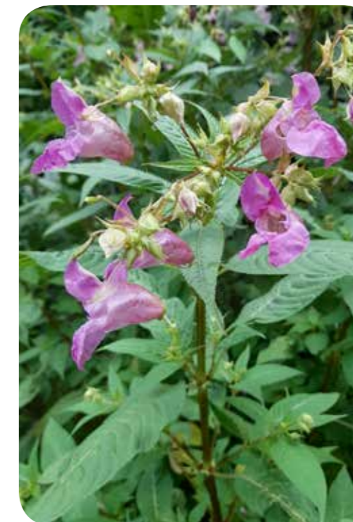
Das Drüsiges Springkraut Impatiens glandulifera

Auch für die Wildkräuterküche ist das Drüsiges Springkraut ein Gewinn. Die Samen eignen sich als nussiges Topping für Salate und Gemüsegerichte sowie als Zutat in Gebäck und Müsli. Durch den Verzehr der Samen dämmt man gleichzeitig die Verbreitung der einjährigen Pflanze ein und trägt so zum Schutz der heimischen Flora bei.