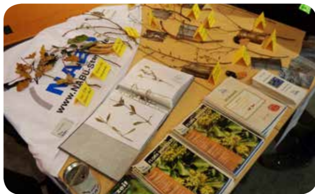
Infostand der AG Botanik bei einem früheren LWL-Ehrenamtsforum