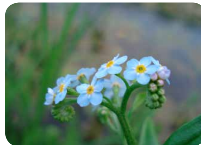
Das Sumpf-Vergissmeinnicht wächst an nassen Standorten

„Fridays for Flowers“-Exkursion bei Gremmendorf für die Flora von Münster. Treffpunkt 16 Uhr Ecke Heermansweg/Angelsachsenweg. Dauer bis ca. 18 Uhr.