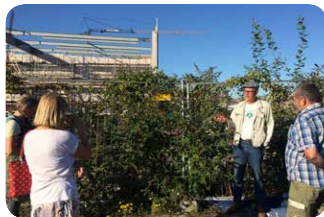
2019 hatte die AG Botanik kurze botanische Führungen durch den Hafen angeboten