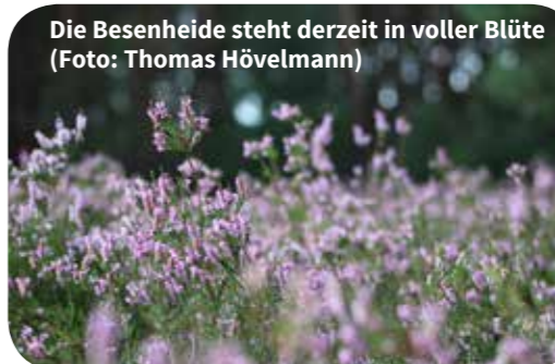
Die Besenheide steht derzeit in voller Blüte

Jubiläumsfeier 40 Jahre NABU Münster. Treffpunkt: 14-18 Uhr im Mühlenhof am Aasee, Kosten 10 €. Anmeldung dringend (möglichst bis gestern...) erforderlich unter 40jahre@naju-muenster.de , Näheres unten und unter https://www.nabu-muenster.de/