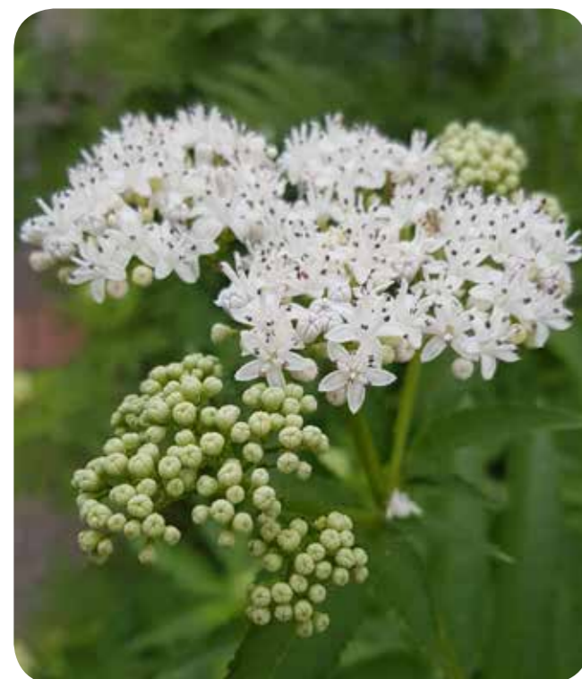
Der Zwerg-Holunder Attich Sambucus ebulus ist giftig und wurde in Coerde entdeckt