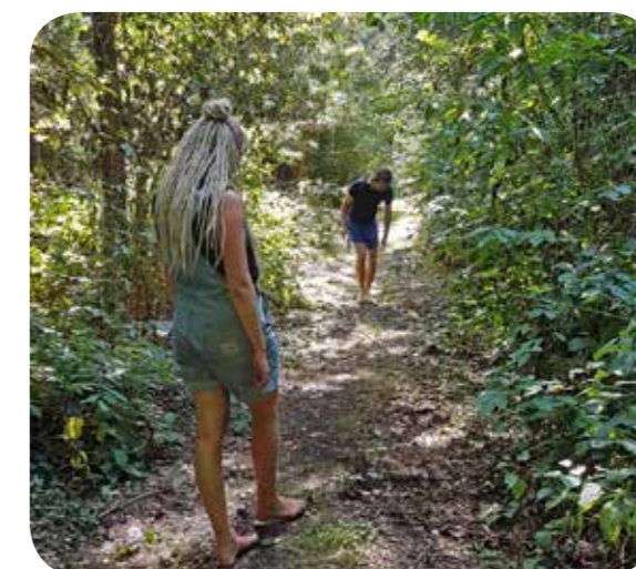
Barfuß auf Pflanzenjagd

Sieger wurde... natürlich das dynamische Jungteam mit mehr als 200 korrekt bestimmten Pflanzenarten! Dabei waren die jungen Leute mit einem Handicap angetreten: nur Sara Kehmer hatte (Barfuß)schuhe an, die beiden anderen kämpften sich barfuß (auf Kölsch: „bläck fööß“) durch stacheliges Brombeer-Gebüsch und Brennnessel-Dickicht. Das änderte aber nichts an dem deutlichen Sieg mit 40 Arten Vorsprung - „Ich freue mich darüber, dass auch der Nachwuchs an Artenkenntnis Freude hat und in kurzer Zeit große Kenntnis über die heimische Flora erlernen konnte!“, gab Hövelmann einen guten Verlierer.