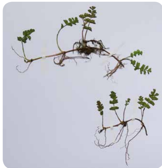
Der Kriechende Sellerie Helosciadium repens aus dem Herbarium „Flora von Münster“