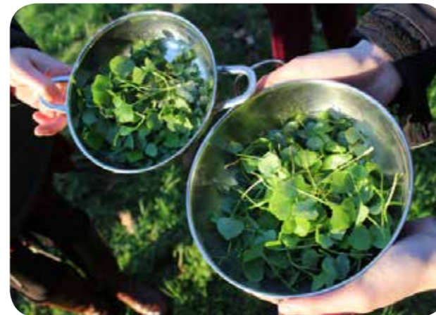
Das Tellerkraut ist eine leckere Wildpflanze