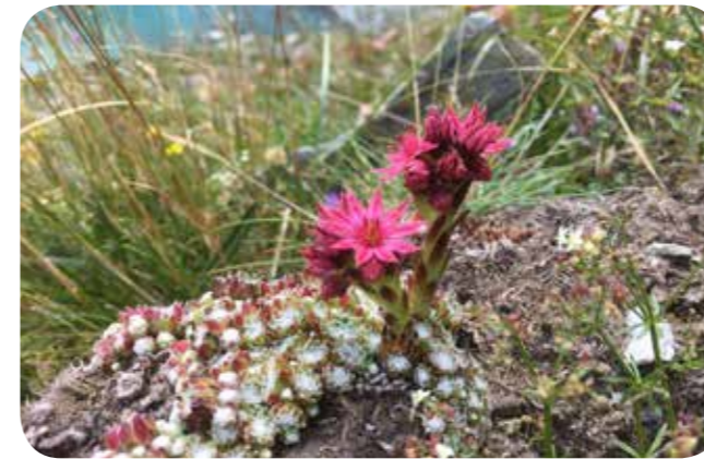
Die Spinnweben-Hauswurz Sempervivum arachnoideum ist eine typische Alpenpflanze“

Mo 7.12.: „ Fiori di montagna - wunderschöne Überlebenskünstler entlang der Grande Traversata Delle Alpi “ von Sabine Paltrinieri und einem kurzen Jahresrückblick 2020 von Dr. Thomas Hövelmann