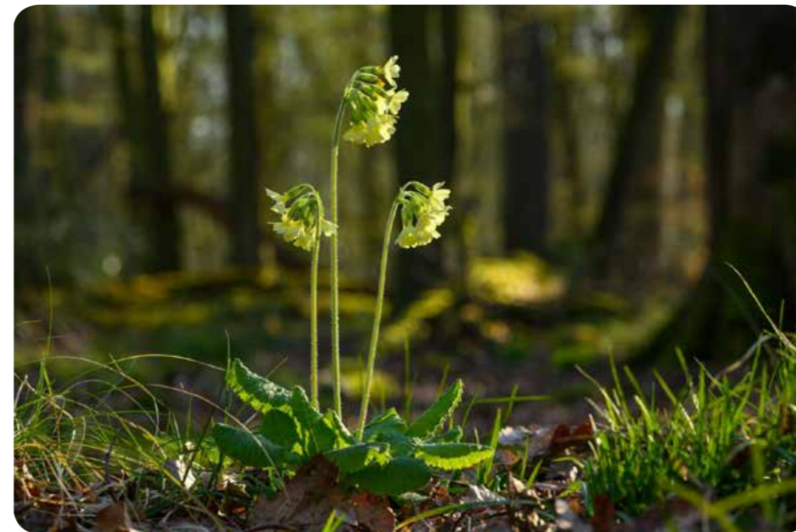
Die Hohe Schlüsselblume Primula elatior in der Davert südlich von Münster

„Pflanzen der Davert“ heißt eine schöne Web-Seite von Dr. Martin Franz, dem Leiter der AG Naturfotografie beim NABU Münster. Die tollen Bilder aus dem größten Waldgebiet im Münsterland wecken unbedingt die Vorfreude auf den Frühling... http://www.martinfranz-muenster.de/Davert-Blumen-2020.php