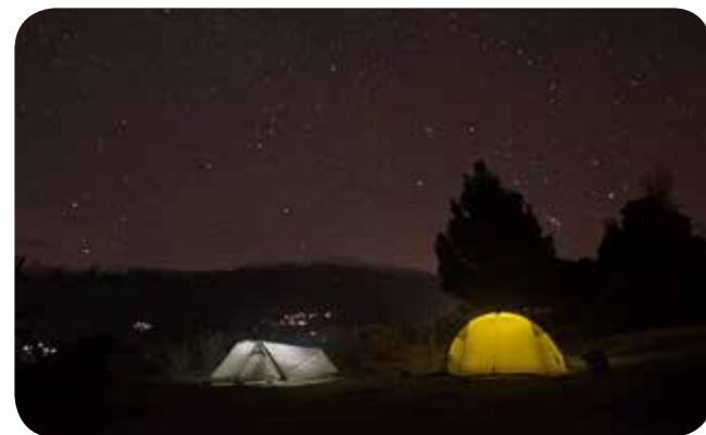
Camping-Idylle in Albanien