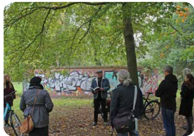
Jährliche Bestandsaufnahme des Kunstwerks sanctuarium durch die AG Botanik

Esche, Feldahorn, Hasel, Efeu, Ei... – Moment mal! Stand hier vor nicht allzu langer Zeit nicht noch eine ausgewachsene Eiche? Oder war es eine Esche? Die Mitglieder der AG Botanik sind ratlos. Wie jedes Jahr seit nunmehr 23 Jahren haben sie sich an einem Sonntagnachmittag im Oktober rund um das sanctuarium versammelt. Das ungewöhnliche Kunstwerk wurde 1997 im Rahmen der Ausstellung Skulptur.Projekte in Münster vom niederländischen Künstler Herman de Vries erbaut.