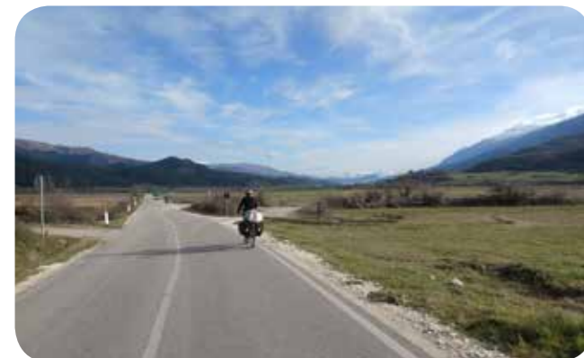
Mit dem Fahrrad auf dem Balkan unterwegs