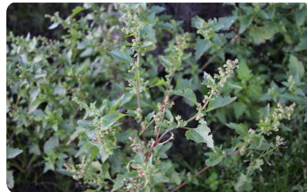
Der Mauer-Gänsefuß im Hafen von Münster